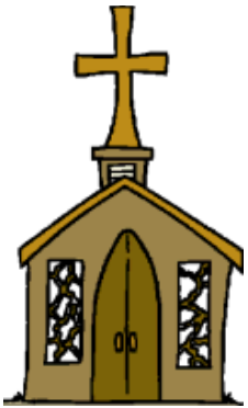
La Iglesia Bautista de su villa, pueblo, o ciudad

Suena sencillo, pero es verdad. BCNM y las asociaciones Bautistas no existen sin las iglesias locales de Nuevo México. Una iglesia Bautista es plantada en una villa, en un pueblo, o en una ciudad. La iglesia